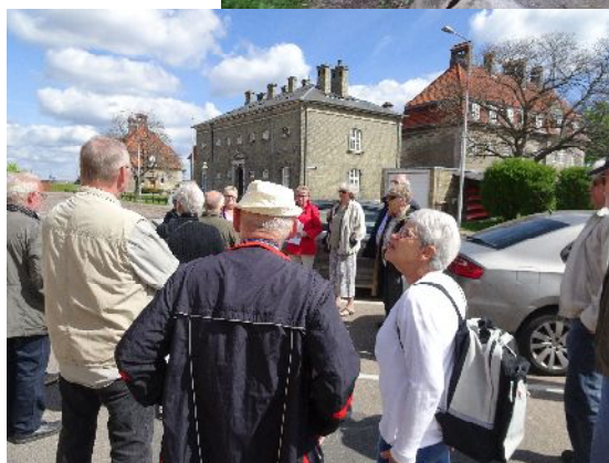
Udflugt til Holmen i 2017