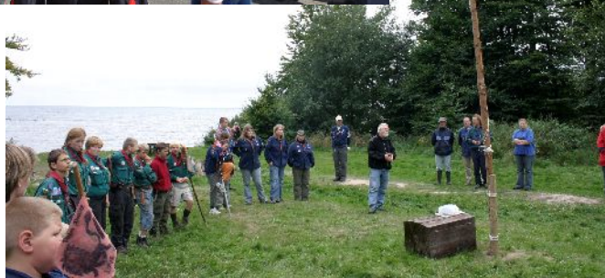
Sct. Georgs- løb i Stran- degårds Dy- rehave i 2005