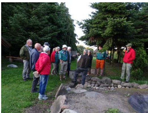
På besøg hos kultsvierne i Kongsted i 2019